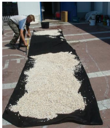
Megmosott kavics szárítása