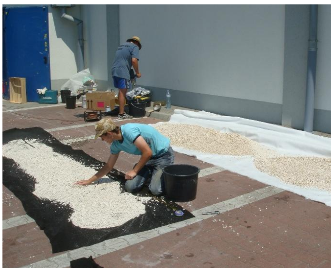
A már megszáradt zúzalék összeszedése