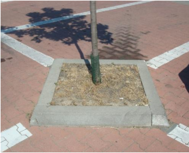
Eredeti fa ültető gödör