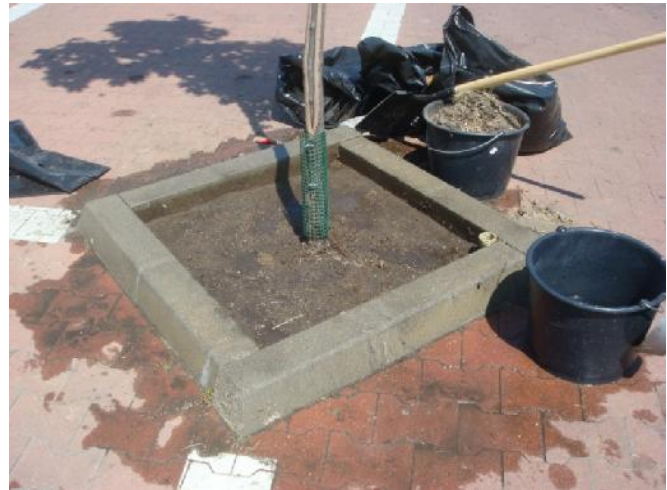
Környezet tisztítása, föld tömörítése vízzel