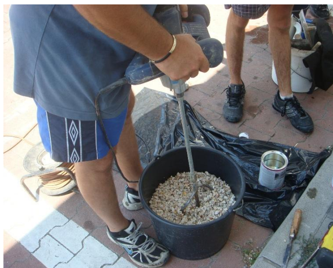
Kavics és a szükséges mennyiségű gyanta alapos összekeverése (50 kg kavicshoz 1 doboz gyanta) Vödörben való keverés esetén \frac{1}{4} adaggal dolgozunk