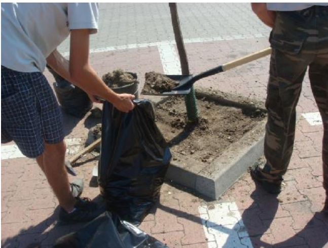
Felső kb. 5 cm föld kisézése