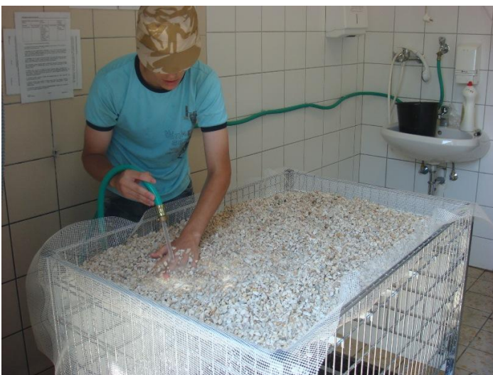
Adalékanyag alapos átmosása, pormentesítése