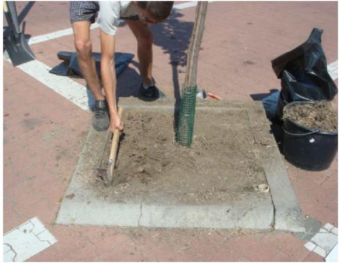
Felső kb. 5 cm föld kisézése